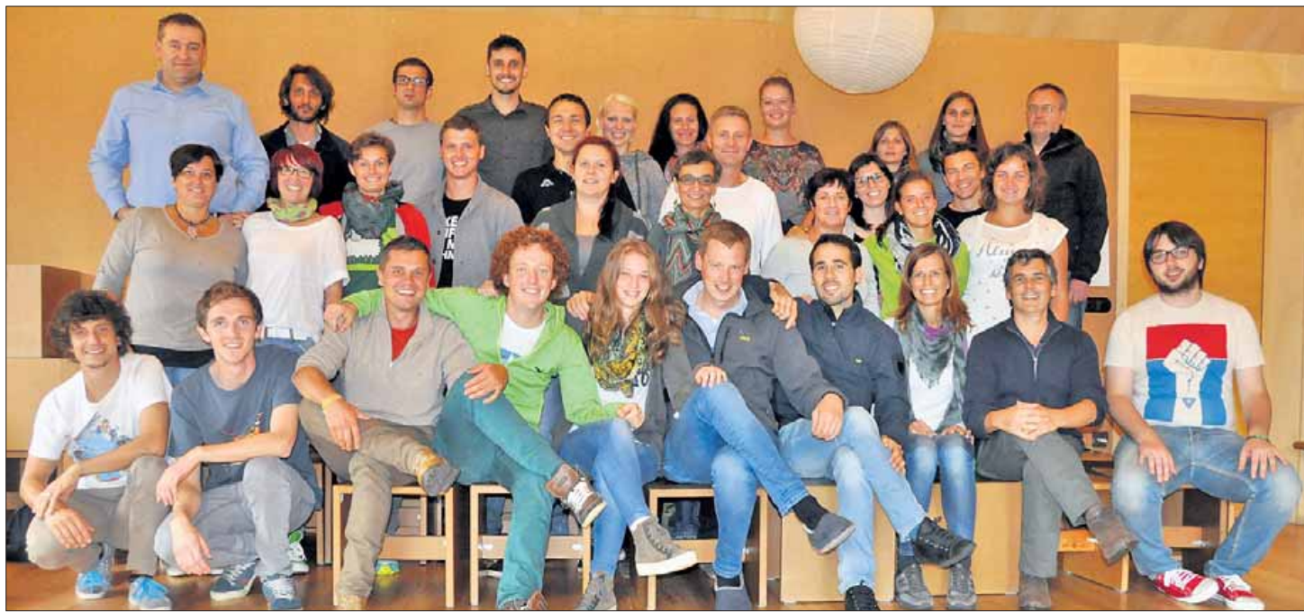
Die Mitarbeitenden der Jugenddienste nutzen die Herbsttagung, um ihre Erfahrungen auszutauschen und neue Projekte zu besprechen. Ein wichtiger Punkt war dabei die interkulturelle Jugendarbeit.

Die Mitarbeitenden der Jugenddienste profitierten vom Fachwissen ihrer Kollegen bei Themen wie die Fünf-Tages-Woche in der Schule und die daraus resultierenden Herausforderungen für die Jugendarbeit, die verschiedenen Beteiligungsprojek-